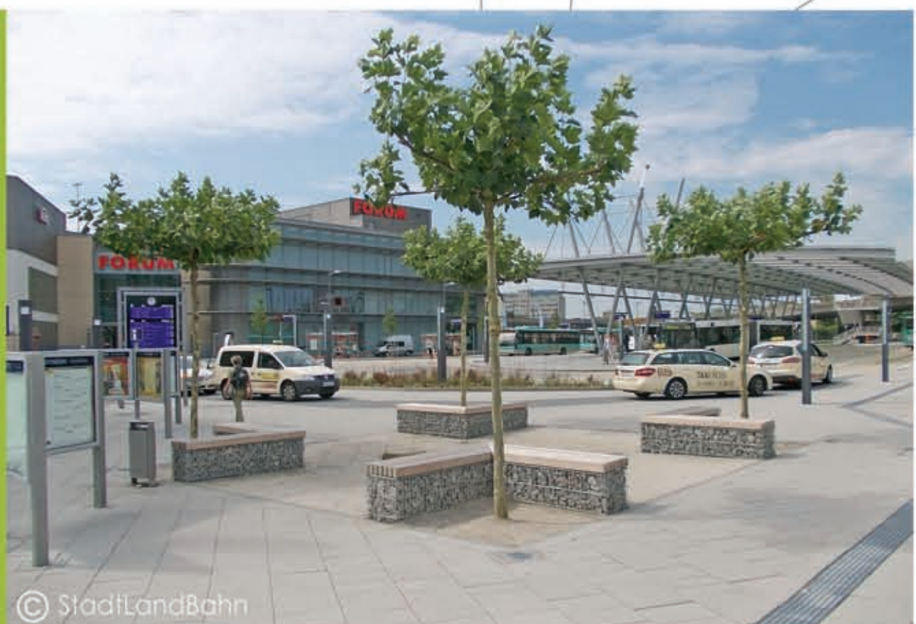
Ruhebereich auf einem Bahnhofsvorplatz