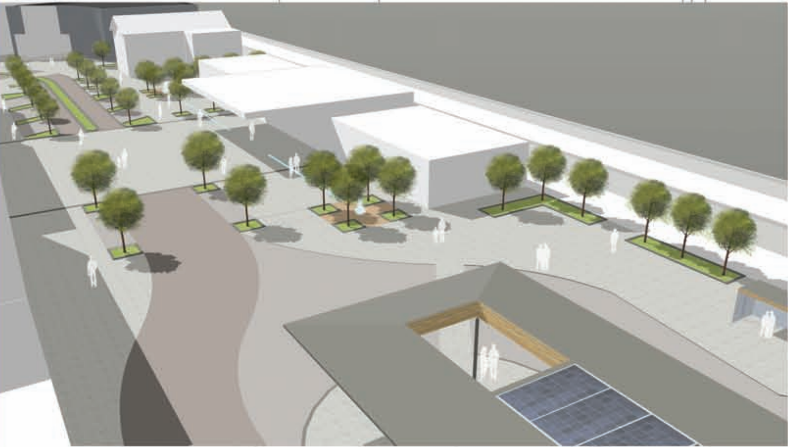
Blick vom neuen Gesundheitszentrum in Richtung Süden