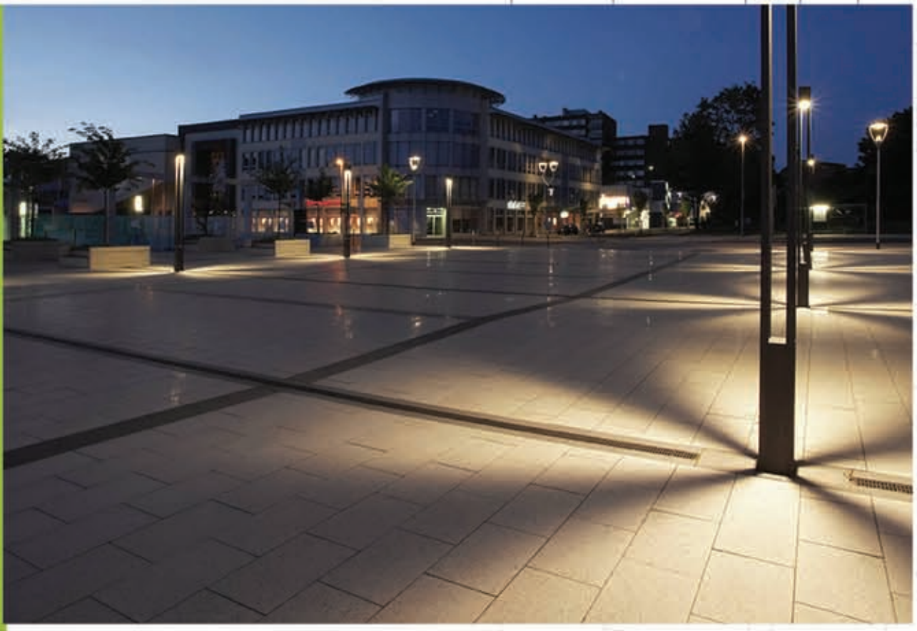
Gestaltetes Bahnhofsumfeld mit anspruchsvollem Beleuchtungskonzept