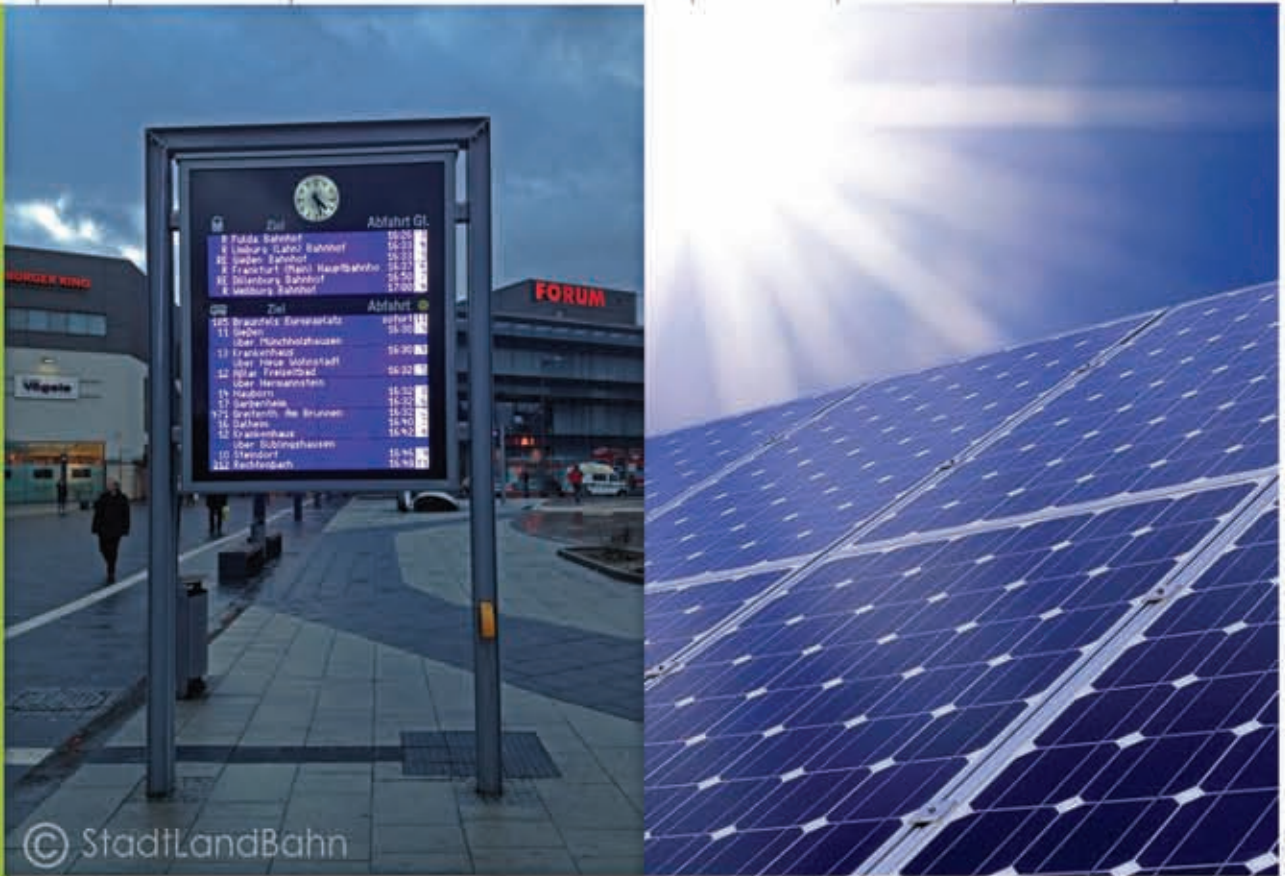
Dynamisches Fahrgastinformationssystem (DFI) in Verbindung mit Solarenergie