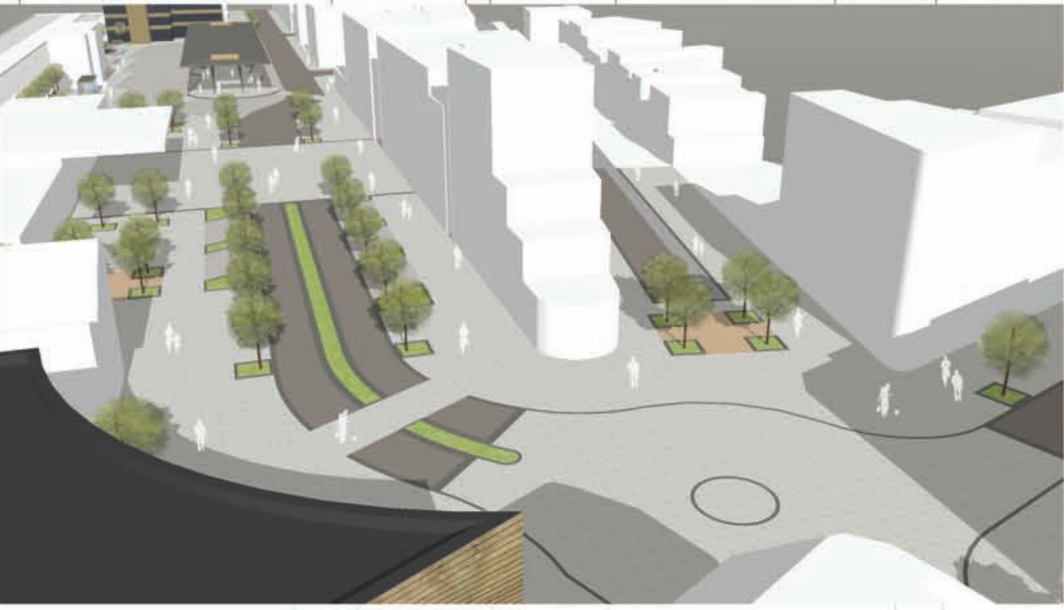
Vogelperspektive vom Dach des Brauhauses (ehem. Post) in Richtung Norden