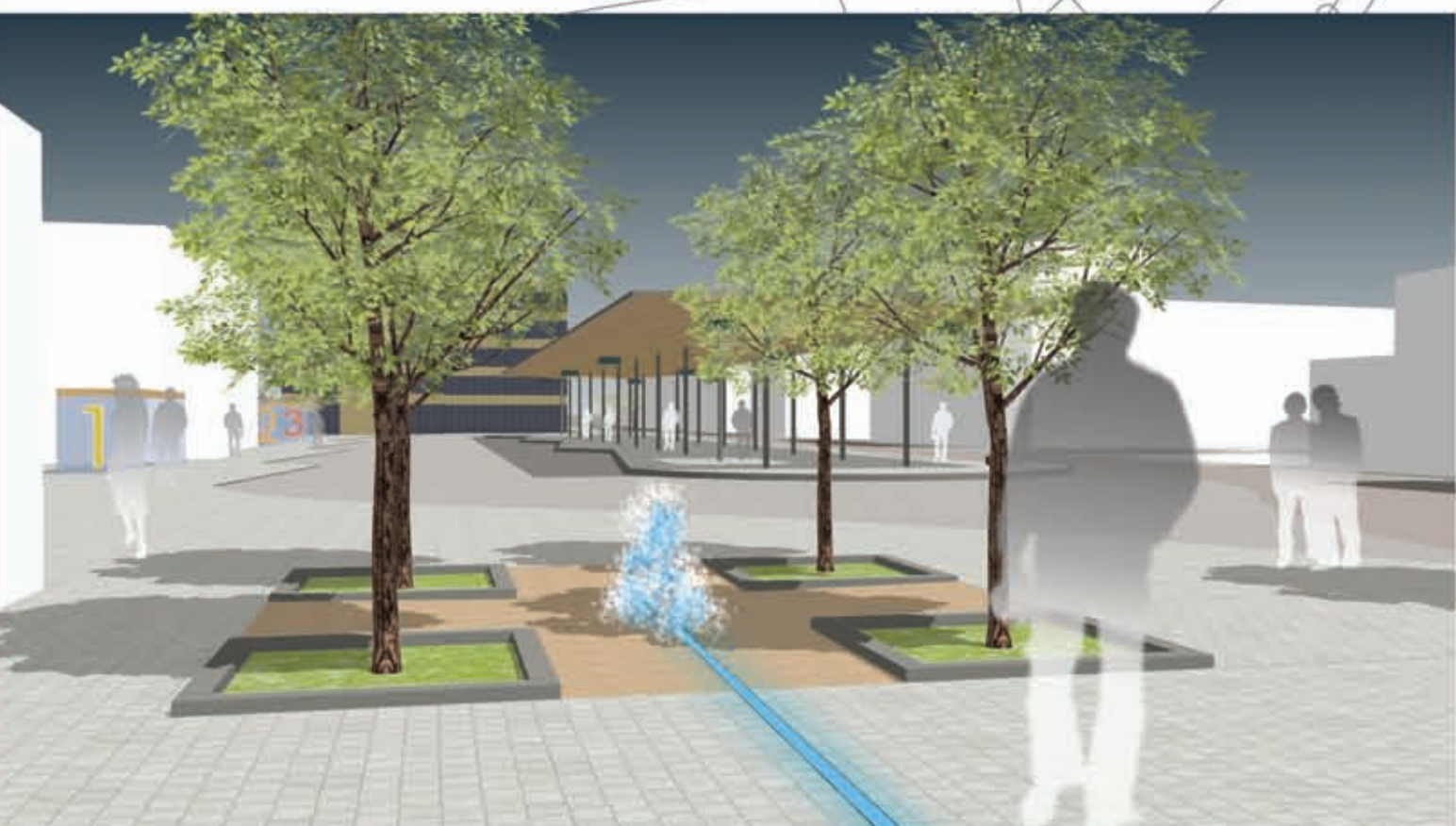
Bahnhofsvorplatz mit Baumkarree und ZOB