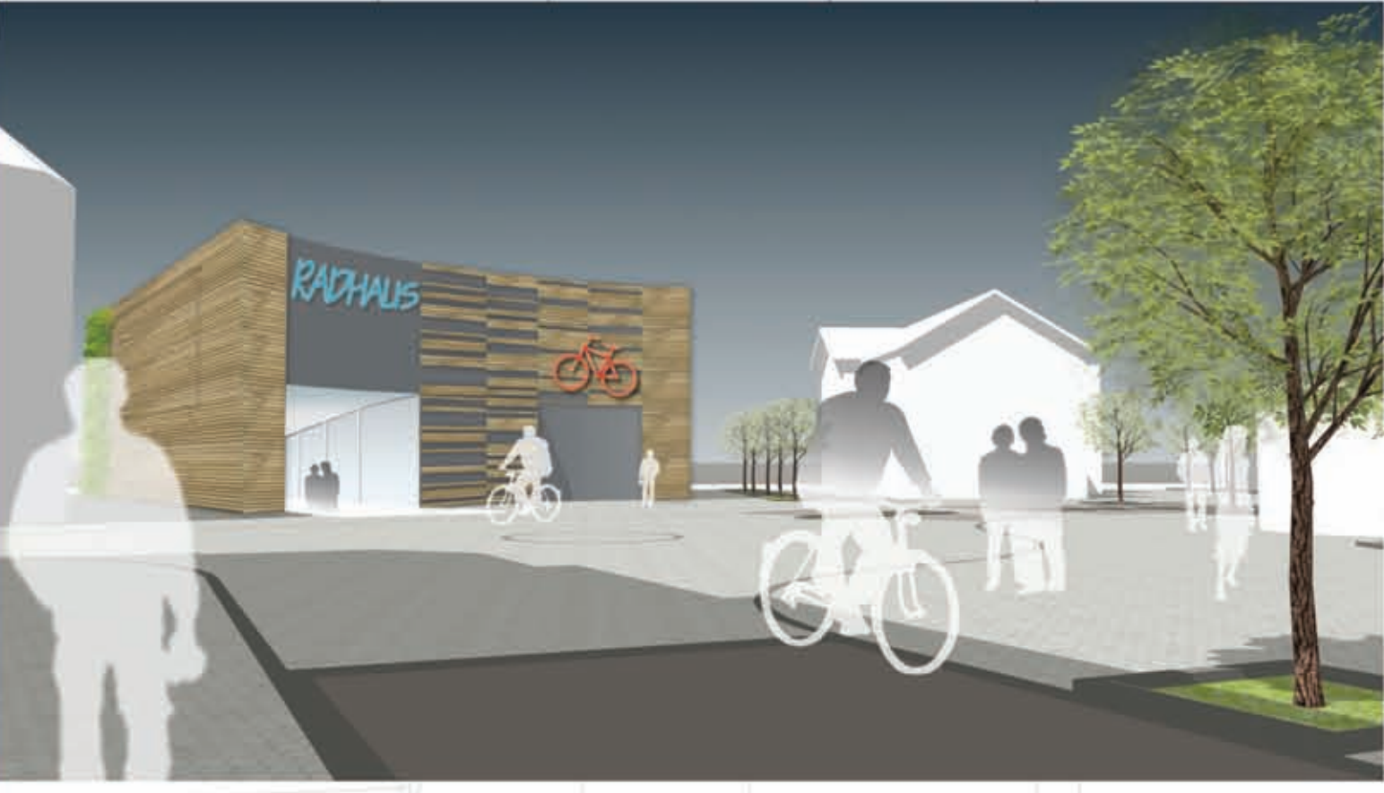
Blick aus Richtung Bahnhofstraße auf das neue Radhaus