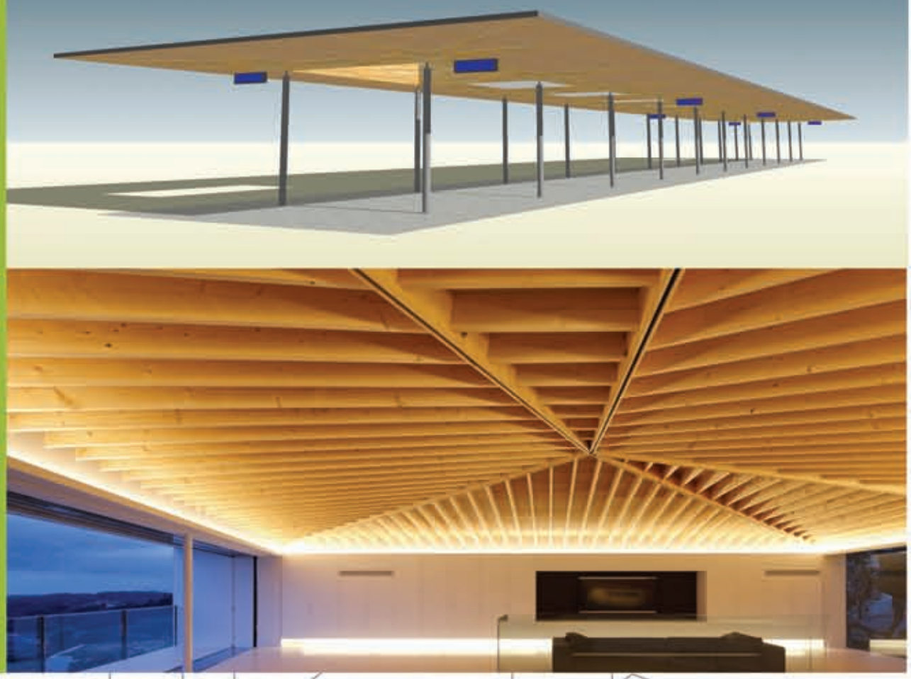
Entwurf ZOB-Dach mit innovativer Holzkonstruktion