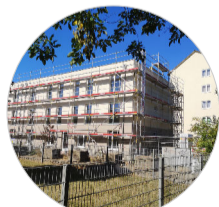
Neubau sorgt für Nachverdichtung