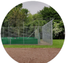
durch Zäune wird die Nutzung des Fußballfeldes verhindert