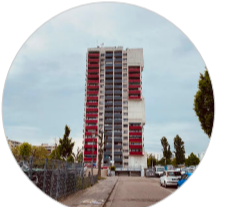
Höchsthäuser sorgen für eine hohe Dichte