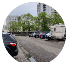
Eingang des Jakobsplatzes ist ein großer Parkplatz