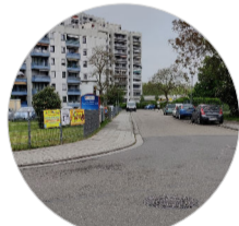
Die Stichstraßen haben eine hohe Auslastung, vor allem zu Stoßzeiten