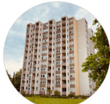
Hochhäuser prägen das Stadtbild im Pilgerpfad