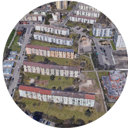
Zeilenbauten aus der Vogelperspektive

Die Kreisfreie Stadt Frankenthal ist über ihre Anschlüsse an die A6 und B9 sehr gut mit den umliegenden größeren Städten wie Ludwigshafen und Mannheim im Süden sowie Worms und Mainz im Norden verbunden.