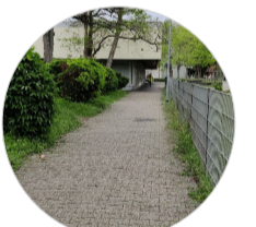
Fußwege verbinden wichtige Orte im Quartier