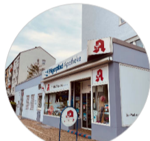
einige Geschäfte zum täglichen Bedarf sind noch vorhanden