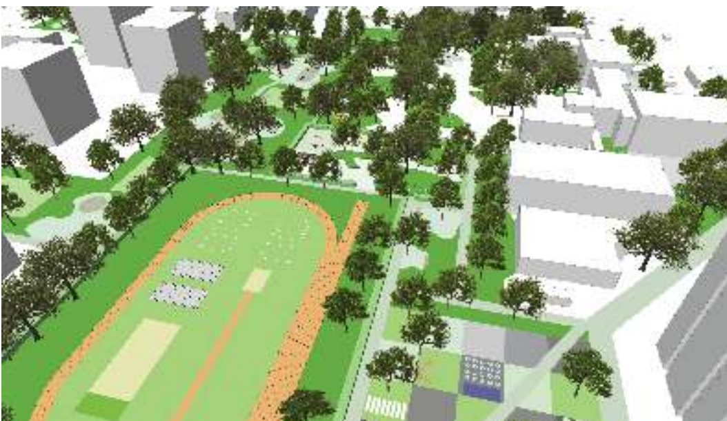
3. neue und benutzbare Sportanlagen