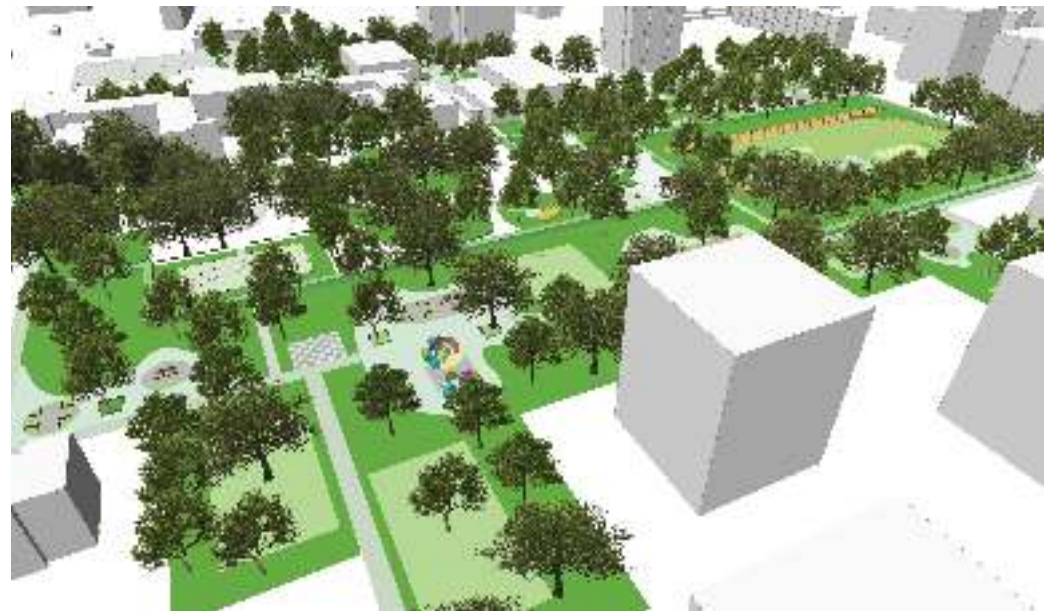
2. mehr Grünflächen durch Pocket-Parks