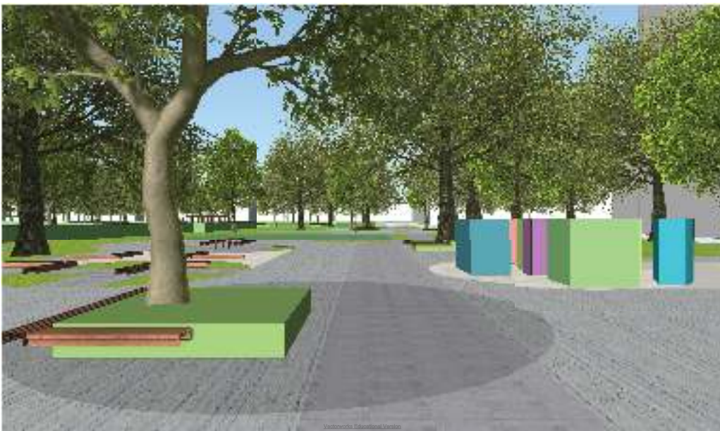
1. Spaziergang durch den Pocket-Park