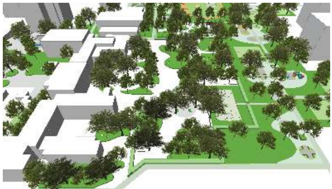
4. Pausenhöfe für beide Schulen