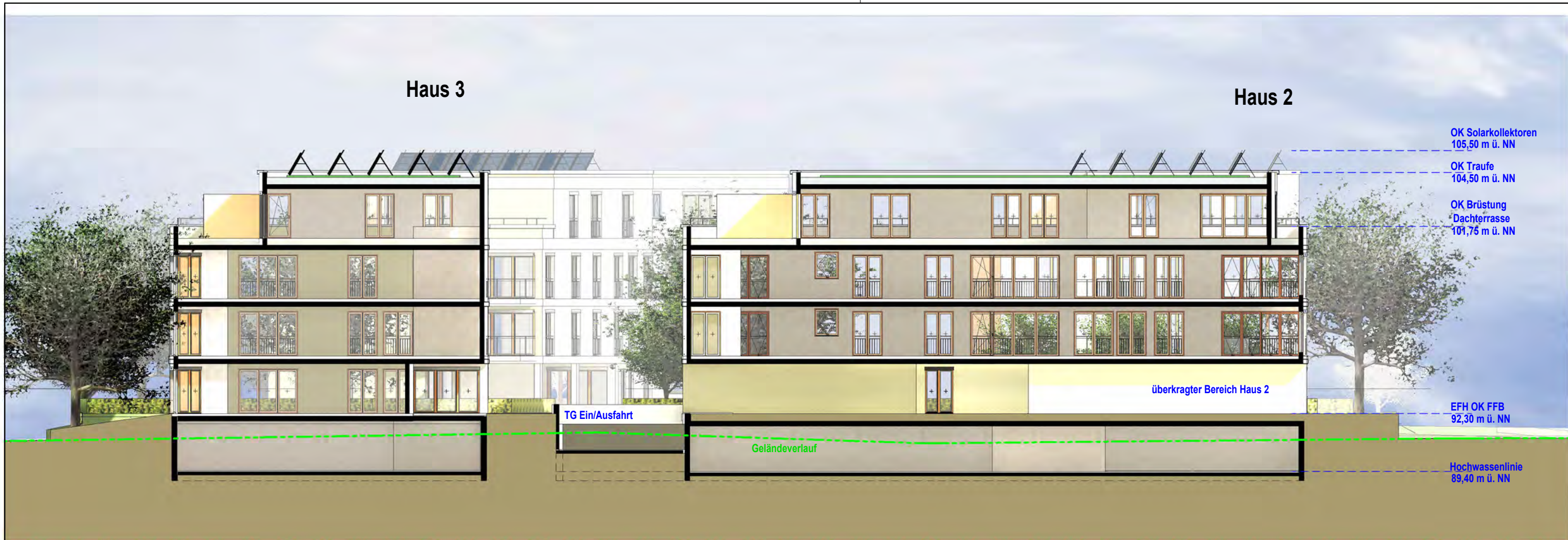
Schnitt B-B NordSüd