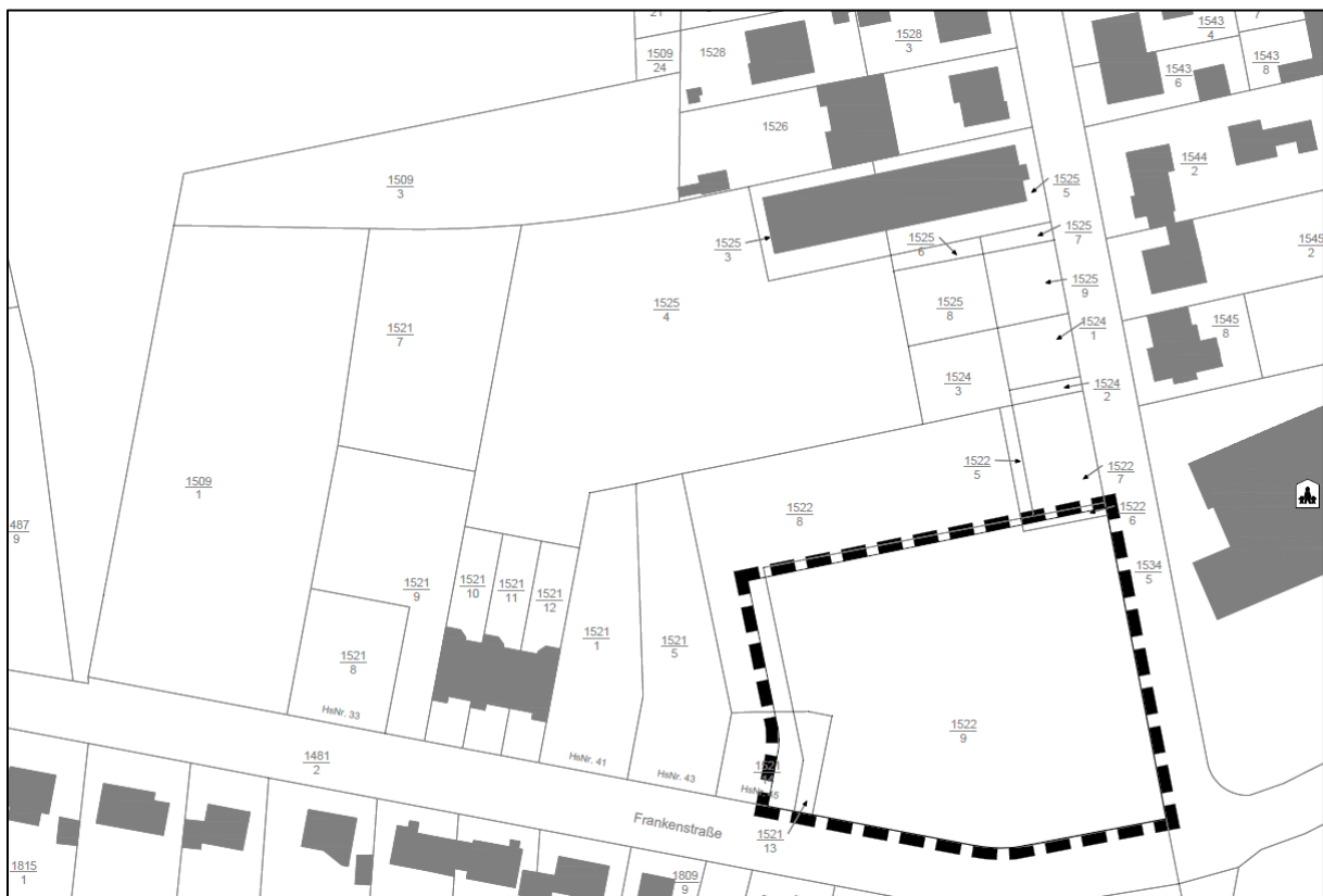
Geltungsbereich Bebauungsplan „Ehemaliges Sternjakob-Areal, Teil C“

Ziel des Bebauungsplans ist die Schaffung von neuem Wohnraum auf einer bisher gewerblich genutzten Fläche.