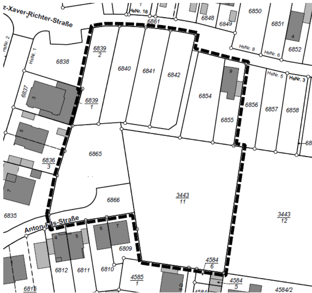
Abb.: Abgrenzungsplan vom 02. März 2015

STADTVERWALTUNG FRANKENTHAL (PFALZ), 11.03.2021