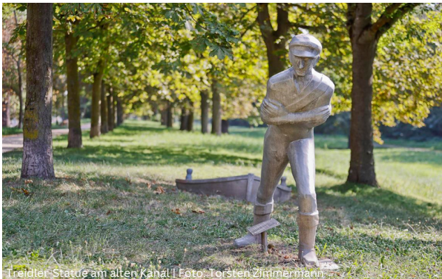
Treidler-Statue am alten Kanal