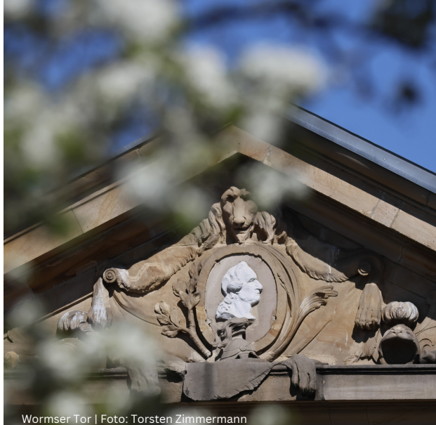
Wormser Tor