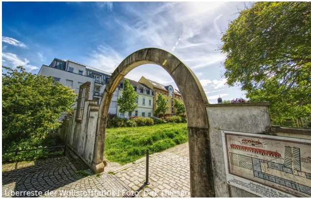
Überreste der Wollstofffabrik

Gebühr: 10 € pro Person, zahlbar vor Ort