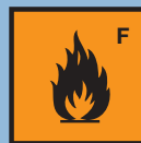
F leicht entzündlich