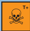
T+ sehr giftig