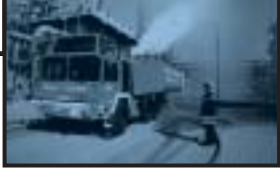
Seit 1996 im Einsatz: Der Turbolöschers der BASF