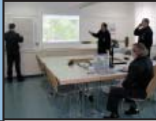
Lagebesprechung bei der Feuerwehr Frankenthal