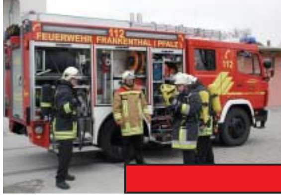
Einsatz bei einem Brand in einer Industrieanlage